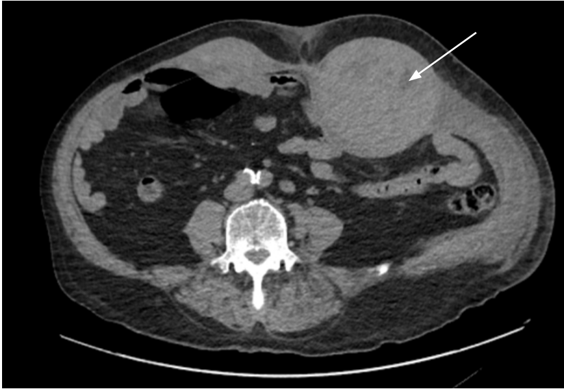
Figura 1. Hematoma bilateral en la vaina de los músculos rectos del abdomen.

estenosis aórtica severa, ictus embólico, enfermedad pulmonar obstructiva crónica (EPOC), enfermedad renal crónica y fibrilación auricular permanente. Como tratamiento tenía prescrito acenocumarol, insulina, bisoprolol y deflazacort. Presentó 20 días antes del episodio actual dolor abdominal secundario a un HEMR derecho, debido a accesos de tos, siendo ingresado en planta de hospitalización durante 7 días. Al alta se le suspendió el anticoagulante y se le prescribió enoxaparina subcutánea (40 mg/12 horas).