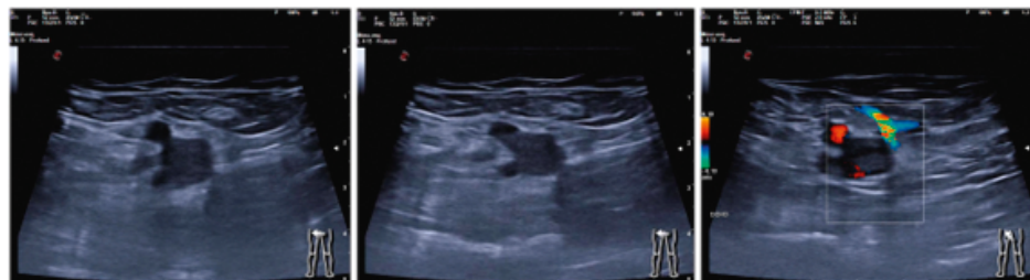
Figura 1. La imagen de la izquierda muestra un corte transversal de la vena y la arteria femorales derecha con un aumento de tamaño de la vena femoral. En la imagen central se observa la ausencia de colapsabilidad de la vena con la compresión. La imagen de la derecha muestra la ausencia de flujo sanguíneo en la vena femoral con vascularización colateral parcial.