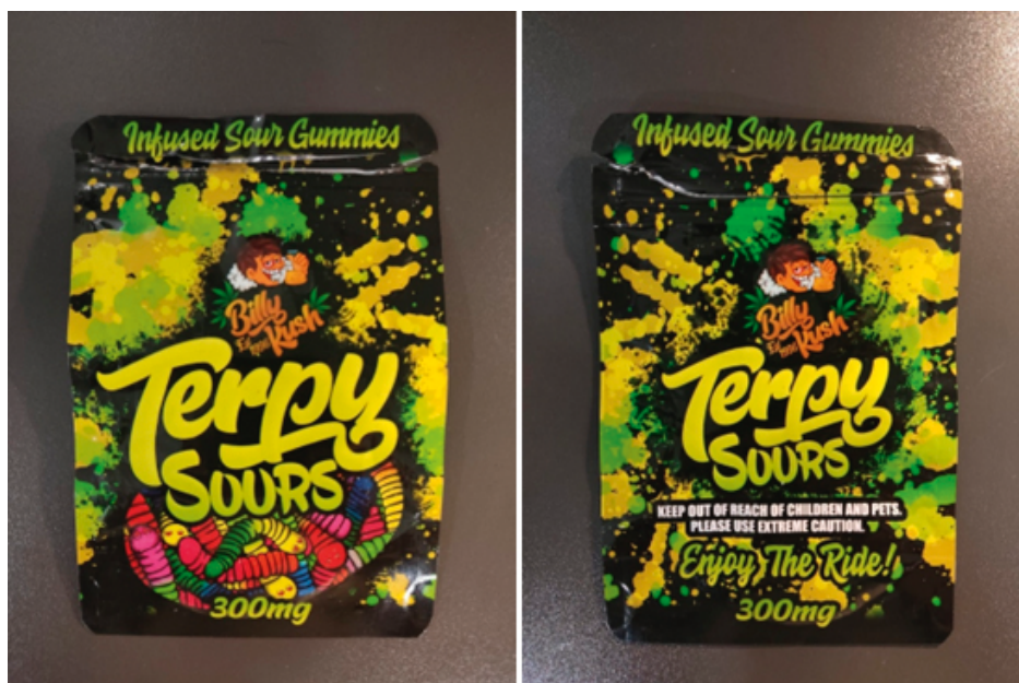
Figura 1. Envoltorio de las gominolas consumidas aportado por la paciente.